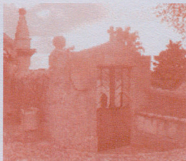
Portal principal del cementeri de Pina

En el cas que hi hagi un nombre de sol·licituds que faci possible la viabilitat de l'ampliació, des de l'Ajuntament iniciarem els tràmits oportuns per dur-les a bon termini.