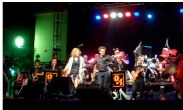
Quatre moments de la festa amb motiu del 25è aniversari de l'Orquestrina d'Algaida dia 30 de maig de 2009. Les fotografies recullen l'actuació del trio de vocalistes.