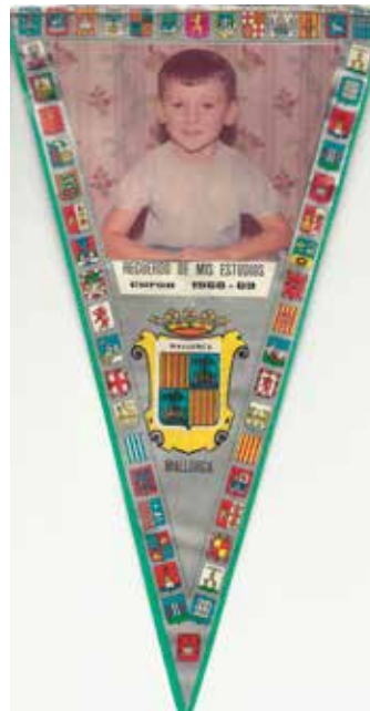
Banderí Recuerdo de mis estudios, del curs 1968-1969, de les Escoles d'Algaida.

En el cul del carrer, travessant la carretera de Manacor, hi trobam l'hostal d'Algaida —«ca ses Guapes», «ses Nines»...— que per a nosaltres, quan érem nins, era el lloc on vàrem veure la primera televisió —en blanc i negre— i on cada dissabte horabaixa